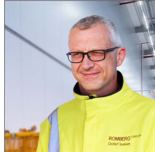
Detlef Iseken ROMBERG Elektrotechnik GmbH